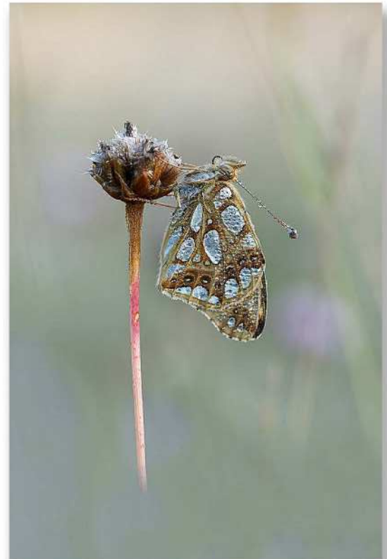
Bernard Polain - PC Angleurois - Au petit matin