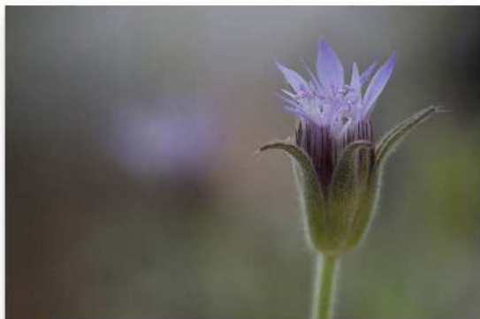
Greta Den Hert - PC Focale 81 - Fleur bleue