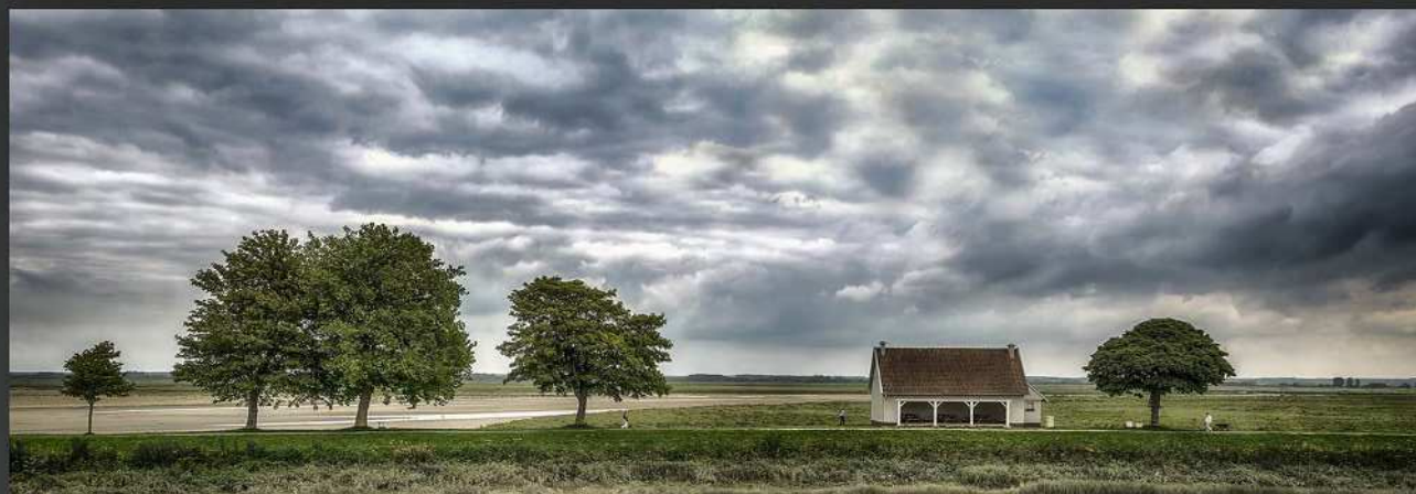
AMBROISE Béatrice - PC Angleurois - Baie de Somme