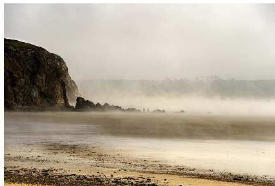
Didier Driessens - PC Optique 80 - Dans l'ambiance