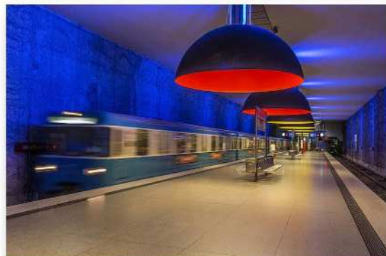
Martin Roehn - PC Focale 81 La Calamine - Metrostation Munich