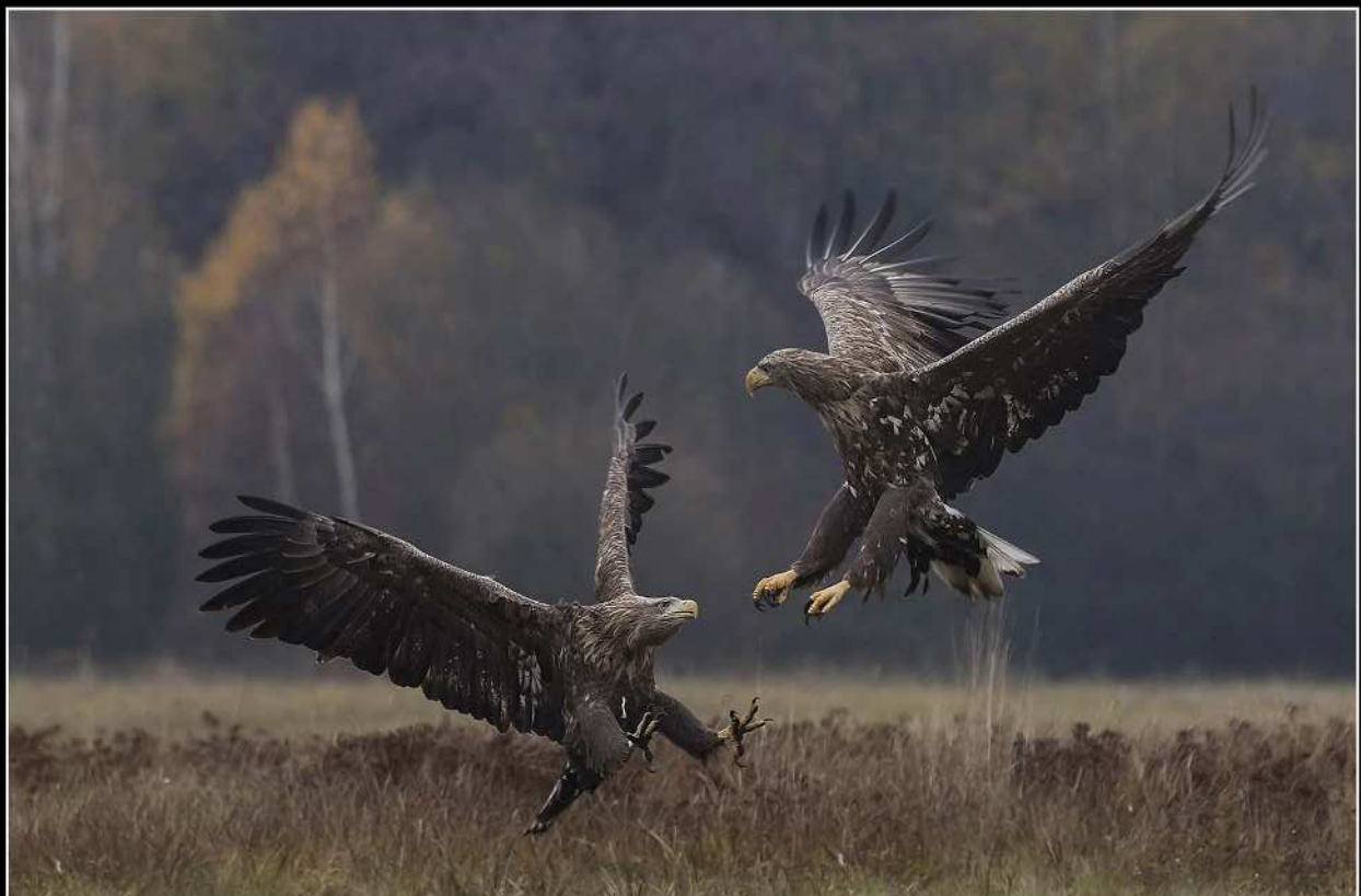
Robert Deglin - PC Renovat Plus - Vechtende arenden