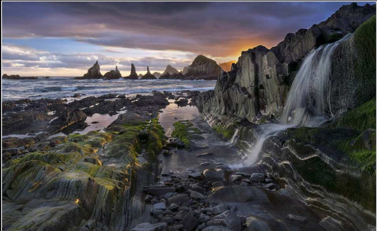
Ghislain Beckers - PC Thimister Clermont - Premiers feux à Gueirua