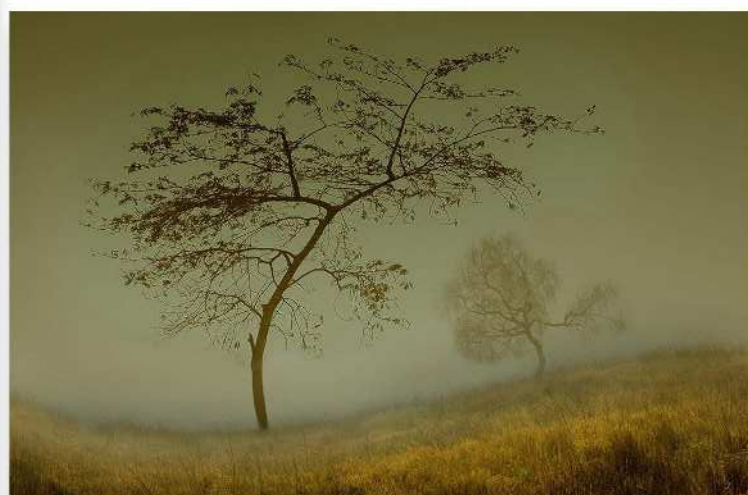
Louis Vancaalsteren - PC La Focale 2001 - Lande