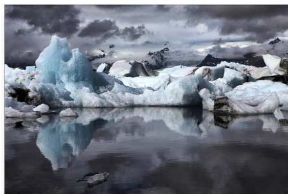
Cécile Honhon - PC Evasion - Lagune Islandaise