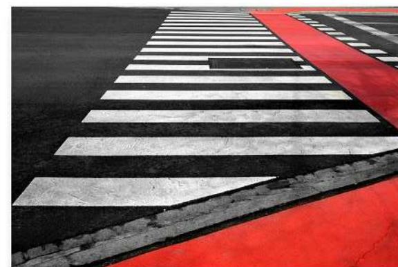
Alain Janseens - PC Angleurois - Passage

Nombre de photos présentées : 120 - 63 Excellentes