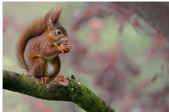
Christian Schumer - PC Angleurois - Ecureuil cassant la noisette