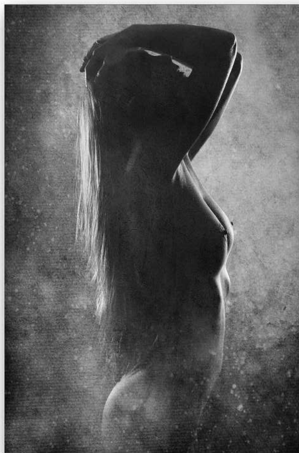
KAELÉN Stéphane - PC ZOOM - Ténèbres

Toutes les excellentes à voir sur le site : http://www.epliphota.be/les-galeries/examen-papier-2016